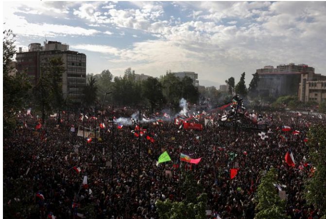
Vista aérea de las protestas contra el modelo económico estatal de Chile. 25 de octubre de 2019.

El 2019 ha sido un año de convulsión social en América Latina. Protestas sociales en Ecuador, Perú, Haití, Nicaragua y Chile; incendios en Brasil; crisis política en Venezuela; triunfos electorales de la izquierda en Bolivia, Argentina y Uruguay; asesinatos contra activistas en Colombia; un histórico aumento de la violencia en México y flujos migratorios sin precedentes desde Centroamérica.