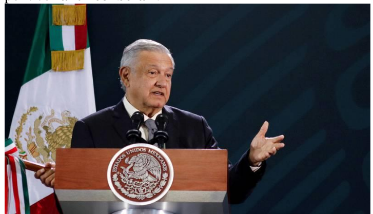
El presidente Andrés Manuel López Obrador, en Oaxaca, México, el 18 de octubre de 2019.

En un sentido paralelo, aunque en contextos políticos distintos, México enfrenta el año más violento de su historia reciente, tras un giro a la izquierda con la llegada de Andrés Manuel López Obrador a la presidencia, quien desde el primer día de su gestión se asumió como un político " antineoliberal ".