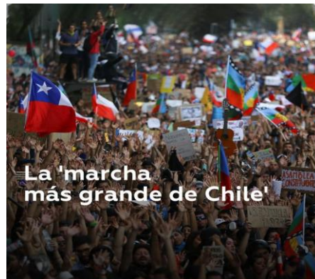
La 'marcha más grande de Chile'

En Santiago de Chile, las protestas y multitudinarias movilizaciones